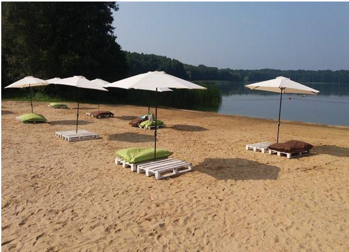
Rys. 2. Miejsce wykorzystywane do kąpieli „Wielkopolska” Rudno (powiat wolsztyński)

We wszystkich kąpieliskach nadzorowanych przez organy Państwowej Inspekcji Sanitarnej w województwie wielkopolskim jakość wody odpowiadała wymaganiom określonym w obowiązującym w/w rozporządzeniu Ministra Zdrowia. W dalszym ciągu obserwuje się niepokojącą proporcję między ilością miejsc wykorzystywanych do kąpieli